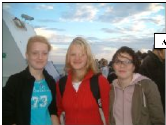
Auf der Fähre

Pünktlich um 17:45 Uhr trafen sich am 03. September 2006 die 11. Klassen um ihre Sprachreise nach Oxford anzutreten. Während wir auf den Bus warteten, wurden die ersten Pläne für die kommende Woche geschmiedet. Dazu hatten wir dann auch genug Zeit, denn der Bus ließ eine ganze Weile auf sich warten. Nachdem er mit „einigen“ Minuten