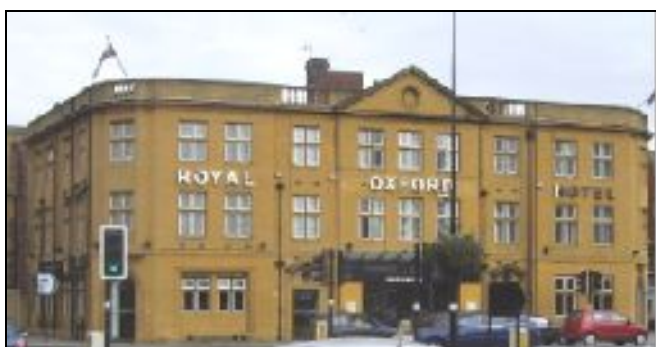
Impressionen aus Oxford

Das erste große Erlebnis hatten wir natürlich auf der Fährüberfahrt von Calais nach Dover, denn bisher war kaum jemand von uns mit einer Fähre oder auch einem Schiff gefahren. Wer den Geldumtausch bis jetzt noch nicht erledigt hatte, tauschte hier noch seine Euros in englische Pfund um. Dies erforderte den ersten Kontakt mit der englischen Sprache. Wir genossen noch ein bisschen den Ausblick der aufgehenden Sonne auf dem Deck, dann war es endlich soweit, englische Küste war in Sicht und wenige Augenblicke später legten wir in Dover an. Von dort setzten wir unsere Fahrt Richtung Oxford fort, dabei war es nicht leicht, sich daran zu gewöhnen auf der nach unserer Ansicht „falschen“ Seite auf der Straße zu